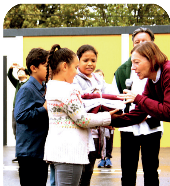
Remise des uniformes au Cours La Passerelle, signe de l'entrée officielle des nouveaux élèves dans l'école.

L'année scolaire 2021-2022 se clôturera par un concours de lecture à voix haute et une représentation théâtrale... de beaux défis que nous avons hâte de découvrir !